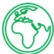
Sociedad y Comunidades